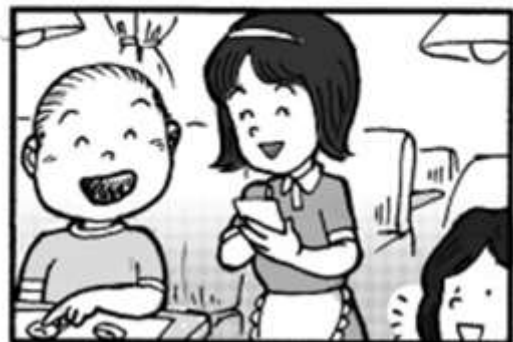
権利擁護漫画ウエルちゃん 「No.28 合理的配慮」 原案&原画 武藤健史

さざんか会の事業所をご利用の相談支援の書類が市役所から送られてきた方は、現在利用中の事業所の職員までご連絡下さい。宜しくお願い致します。